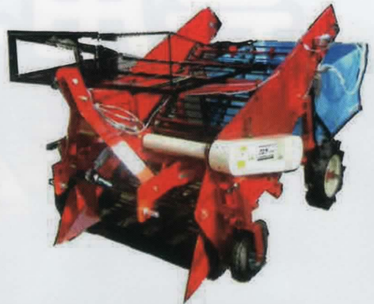
[専用コンテナ装着]