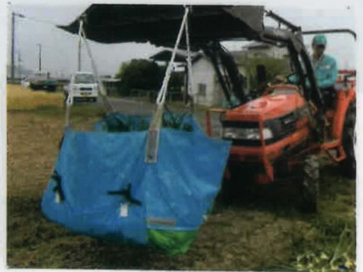
[コンテナ運搬作業]