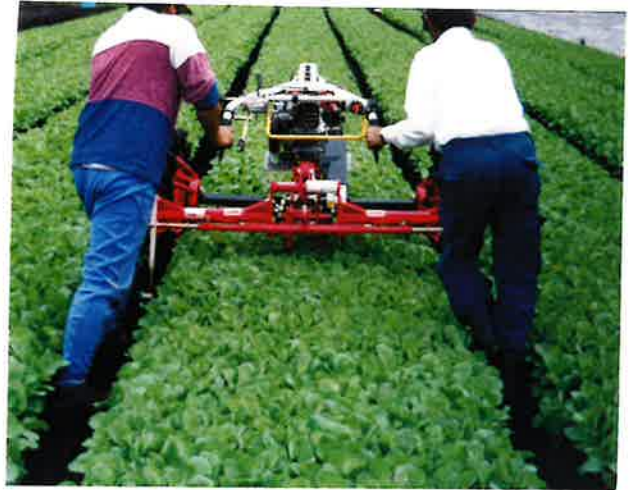
より効率的な二人作業