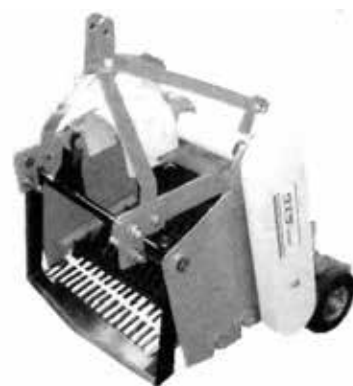
USR-68 (スターローラー式)