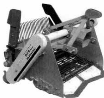
UTD-952R (鎮圧駆動ローラー付)