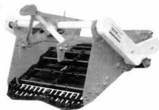
UTD-1052RD (鎮圧駆動ローラー付)