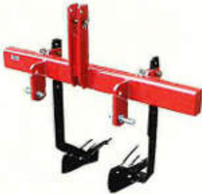
UPN-2300S, 2300L (さつまいも、人参、その他)