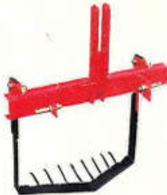
UPN-2300SN, 2300LN (里芋、人参、三つ葉、その他)