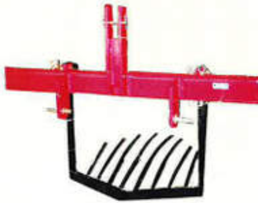
UPN-680NF (人参、里芋、じゃがいも)