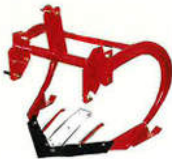
UPN-650N (さつまいも、その他)