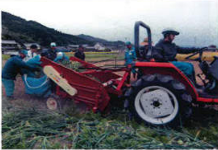
[根葉付掘取収納作業]