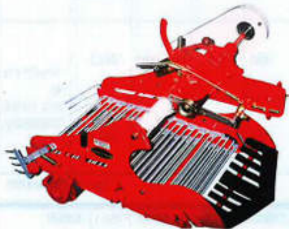
(馬鈴薯・こんにゃく・他球根類) UPD-53NR